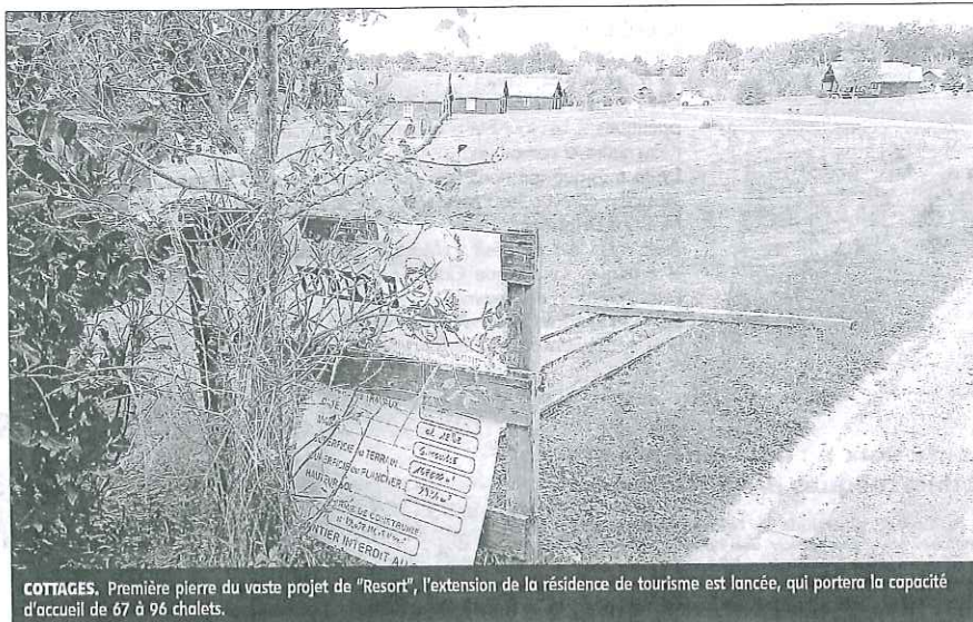
COTTAGES. Première pierre du vaste projet de "Resort", l'extension de la résidence de tourisme est lancée, qui portera la capacité d'accueil de 67 à 96 chalets.

D'un côté, sur l'actuelle résidence de tourisme, l'entrée du site a été préparée pour, la viabilisation